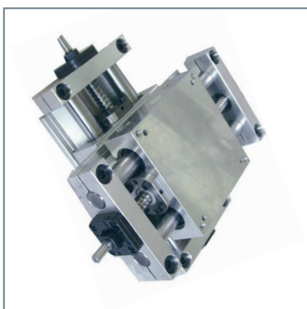
TDO montage X-Y

Les tables de la série TDO , garantissent un mouvement doux et régulier notamment grâce au parfait alignement des deux colonnes de guidage et du système d'entraînement par vis.